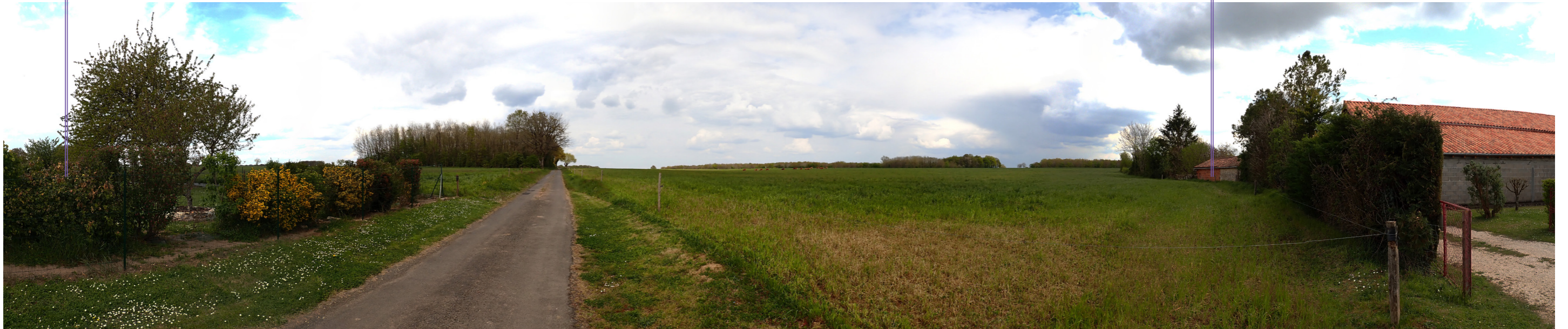
Photo 90 : Depuis les abords du hameau de la Coratière la prégnance du VIP est particulièrement importante