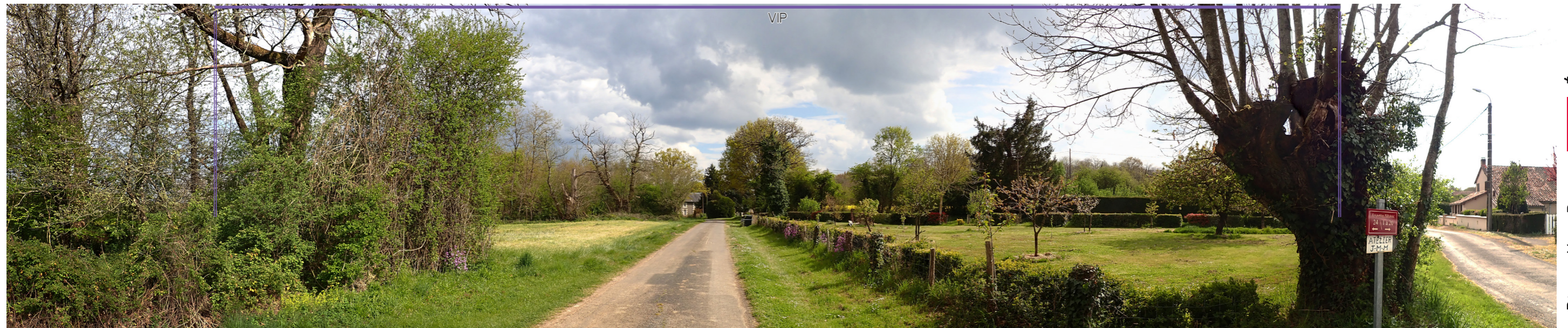
Photo 85 : La prégnance du VIP est importante depuis le hameau des Petites Vilaines