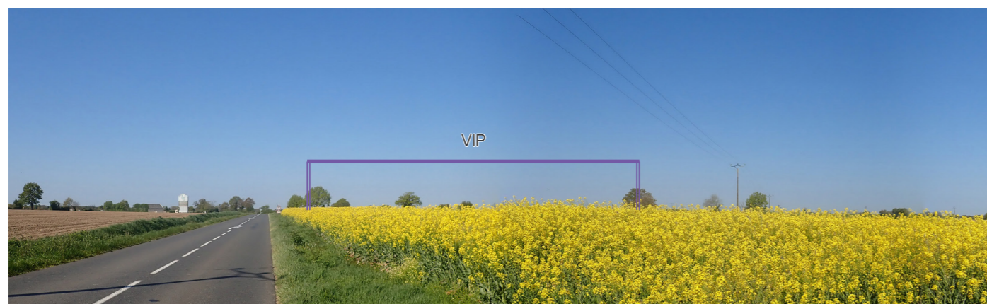
Photo 81 : Depuis la RD 727, le VIP et la silhouette de la ville de la Chapelle-Bâton sont visibles simultanément dans le même angle de vue, le VIP apparaît pleinement