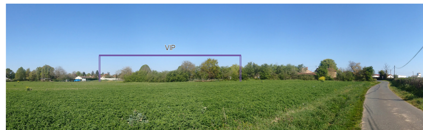
Photo 82 : Depuis la frange sud de la Chapelle-Bâton, le VIP est partiellement filtré par la trame bâtie du village et les boisements en périphérie