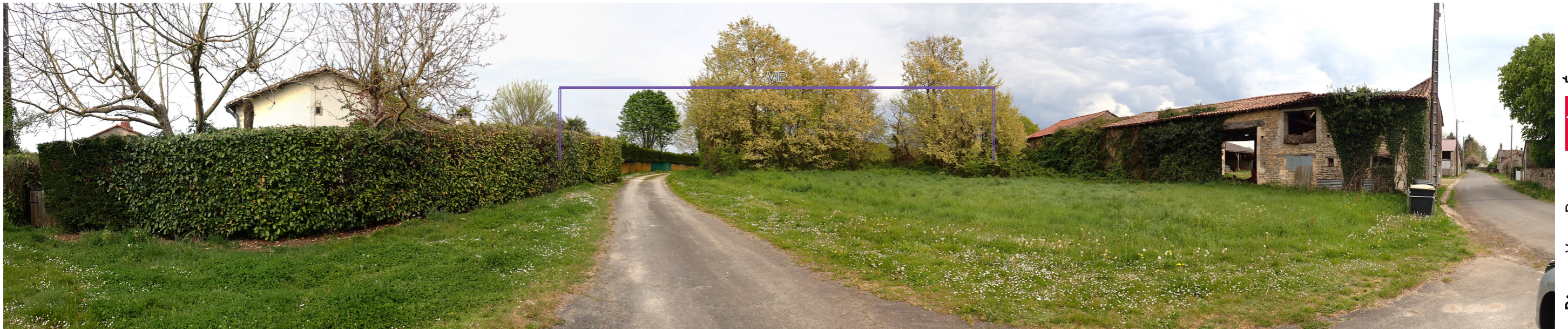
Photo 91 : La vue vers le VIP est filtrée par la végétation à la sortie du hameau de la Groie