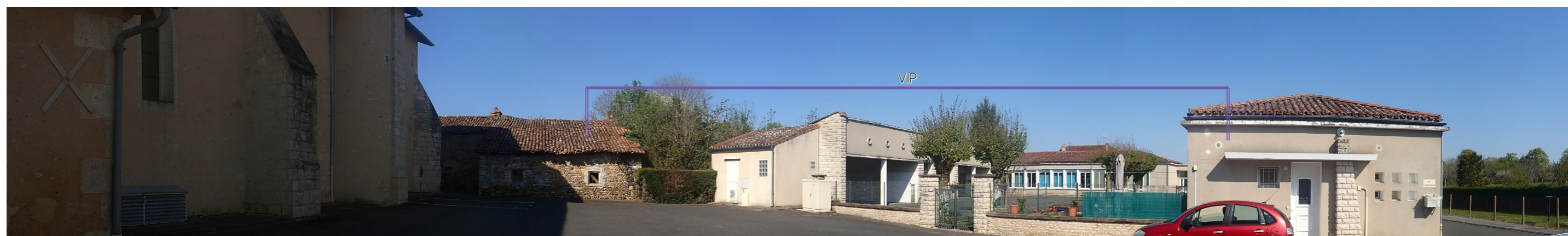
Photo 83 : Depuis la place Capella, le VIP est tronqué par la trame bâtie du village, mais sa hauteur apparente est très importante