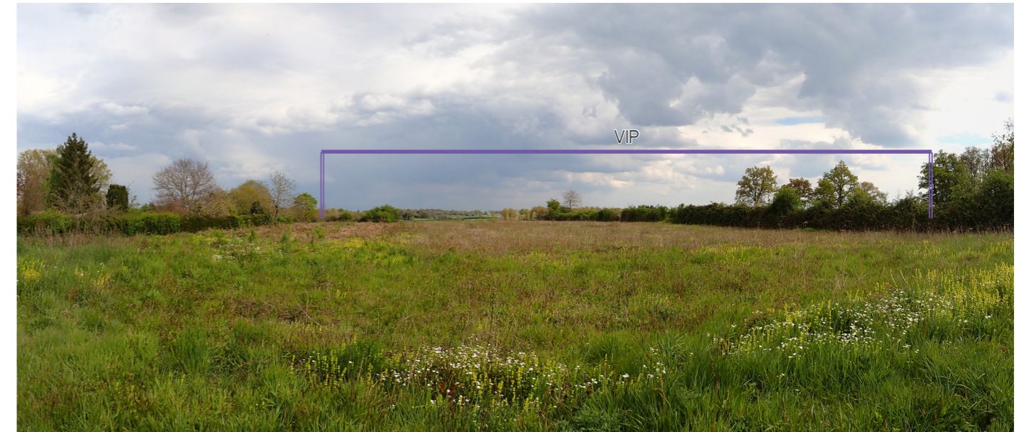
Photo 86 : La vue est ouverte et dégagée en direction du VIP mais les masses végétales qui cernent le hameau filtrent les perceptions sur le projet

Une carte de synthèse sur la sensibilité de l'ensemble de l'habitat de l'aire immédiate (bourgs et hameaux) est présentée à la fin du reportage photographique commenté ci-après.