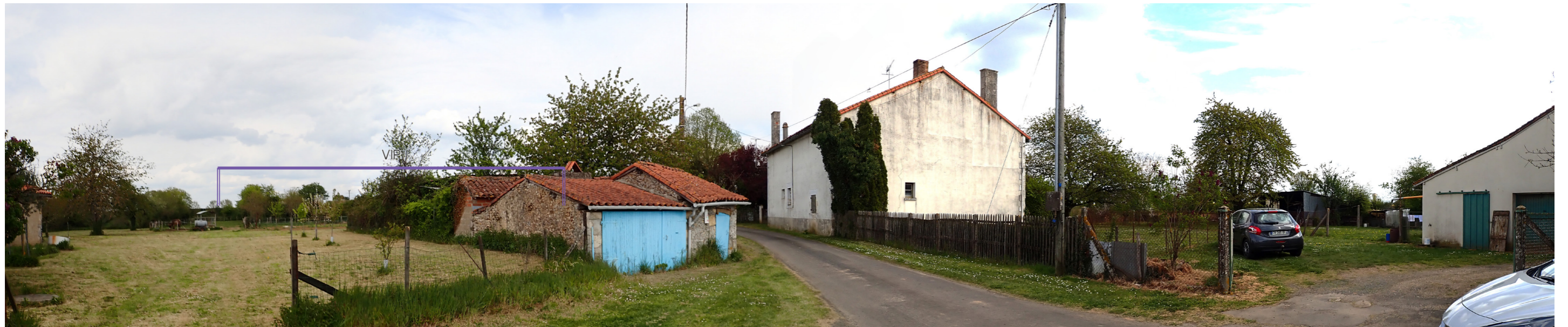
Photo 89 : Depuis le hameau de la Boufarde les vues sont en partie filtrées en direction du VIP par des masses végétales et la trame bâtie