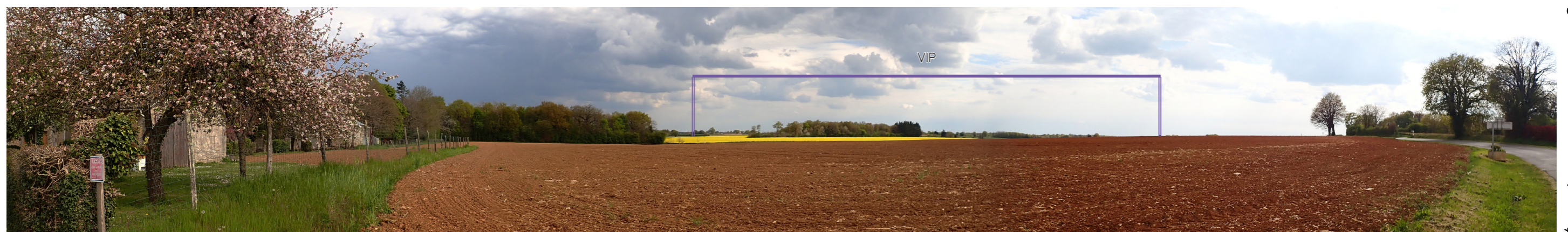
Photo 80 : Depuis la RD 28 le VIP apparaît pleinement et avec une prégnance importante