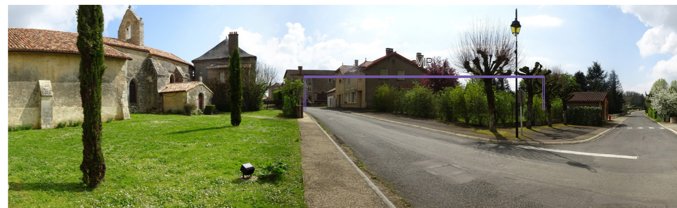
Photo 77 : Depuis la route des Châtaigneraies, le VIP est tronqué par la végétation et la trame bâtie du village