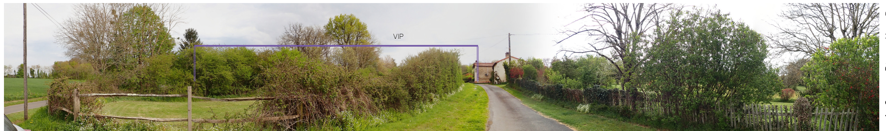
Photo 79 : Depuis la frange nord de Saint Romain, les vues en direction du VIP sont filtrées par les boisements du village