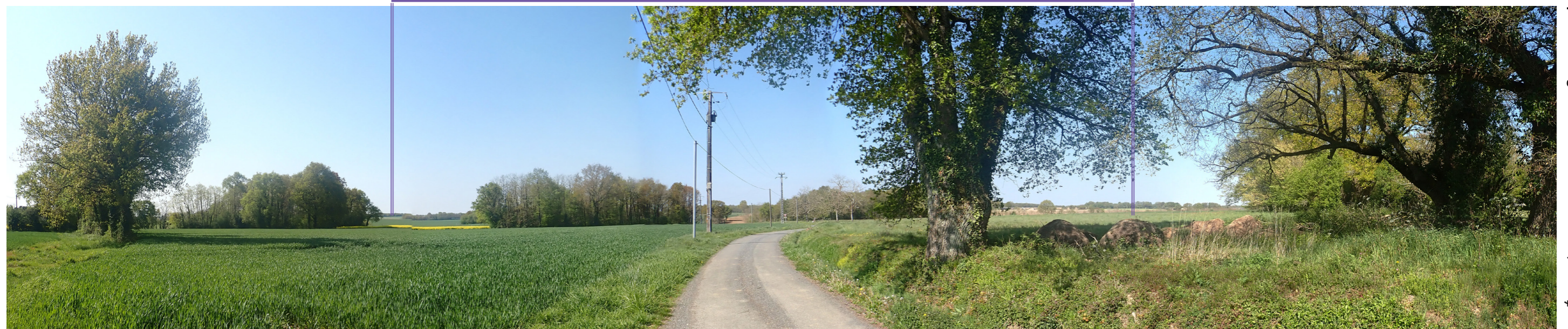
Photo 84 : La hauteur apparente du VIP est importante depuis la sortie du hameau de l'Héraudière