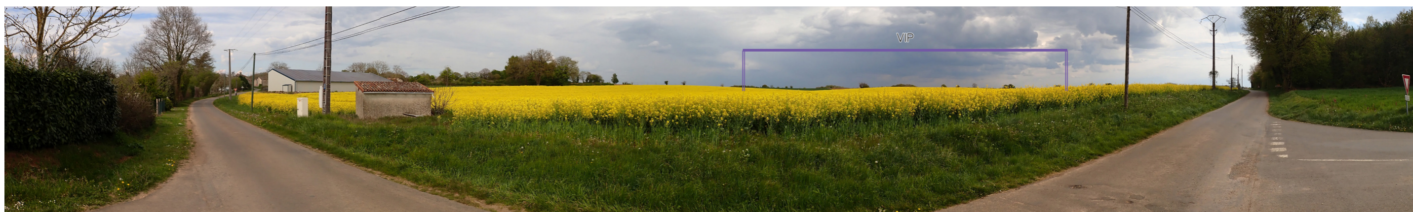
Photo 78 : Depuis la RD 27, la vue est ouverte en direction du VIP