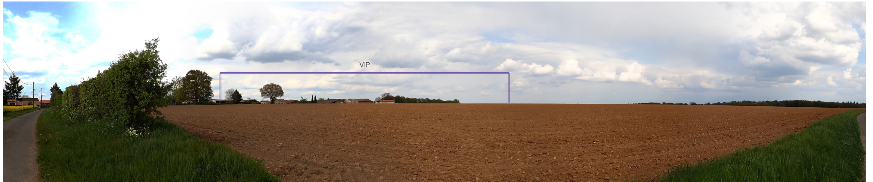
Photo 88 : Les vues sont ouvertes en direction du VIP depuis le hameau Chez Benéteau, il y a également un risque de covisibilité avec le hameau des Pigeries