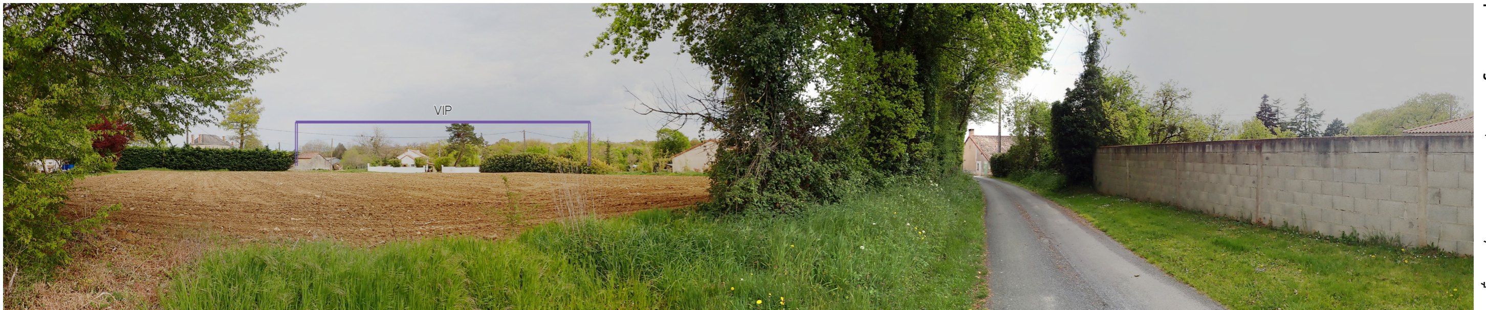
Photo 92 : Depuis le hameau de Leigné, le VIP est partiellement filtré par la végétation