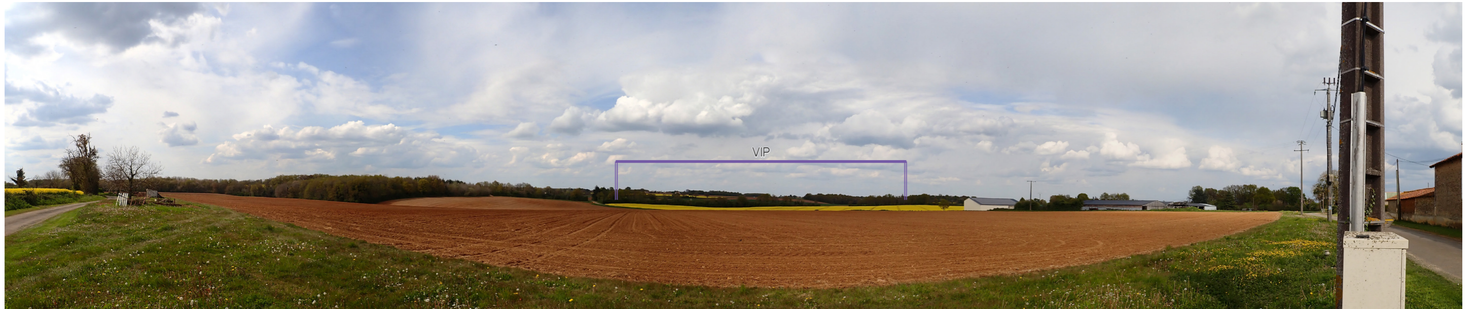
Photo 87 : Depuis les abords du hameau Chez Rantonneau les vues sont ouvertes et dégagées en direction du VIP